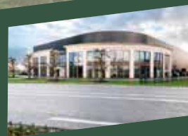
VTH Opheusden Pottenveld 2

www.vth.nl info@vth.nl +31(0)418-59 23 55