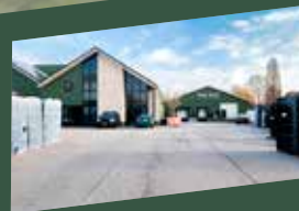
VTH Tuil Bouwing 2a