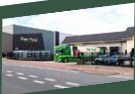
VTH Haafden Hertog Karelweg 25